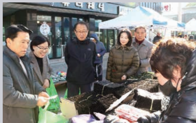
사회문화위원회 민생현장 방문 | 2025. 2. 13.(목) 동해