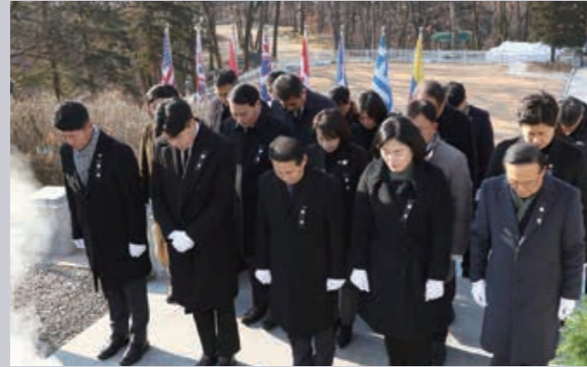
2025년 신년 총렬탑 참배 | 2025. 1. 2.(목) 총렬탑