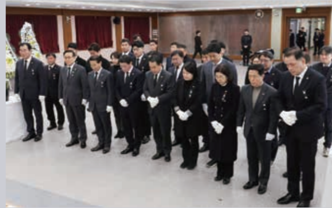
제주항공 참사 합동분향 | 2025. 1. 2.(목) 강원특별자치도청별관