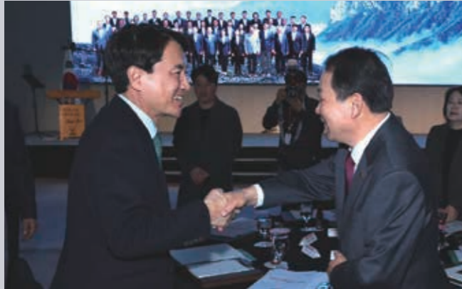
2025년도 강원특별자치도의회 의원총회 | 2025. 1. 22.(수) 속초