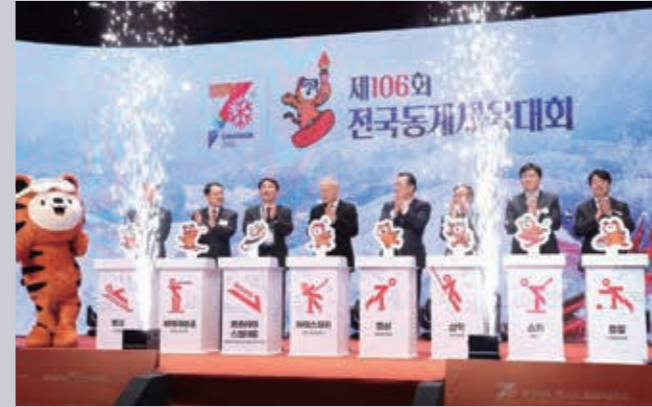
전국동계체육대회 개회식 | 2025. 2. 18.(화) 평창(모나용평)