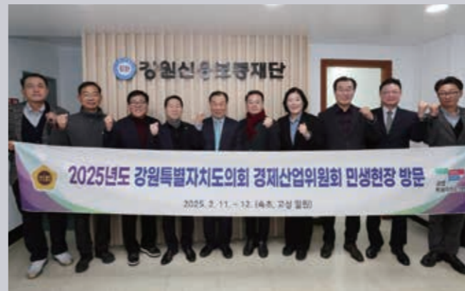
경제산업위원회 민생현장 방문 | 2025. 2. 11.(화) 속초, 고성