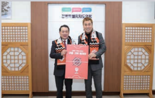
강원FC 시즌권구매 릴레이행사 | 2025. 2. 3.(월) 강원특별자치도의회