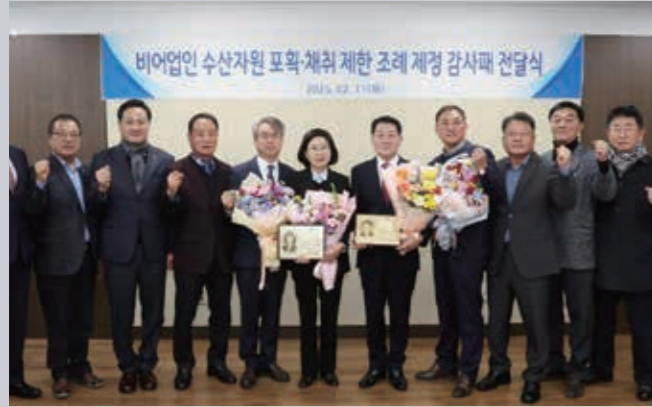
비어업인 수산자원 포획,채취 제한 조례 제정 감사패 전달식 | 2025. 2. 11.(화) 수협 강원본부