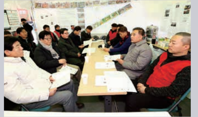
폐광지역개발특별위원회 민생현장 방문 | 2025. 1. 16.(목) 삼척