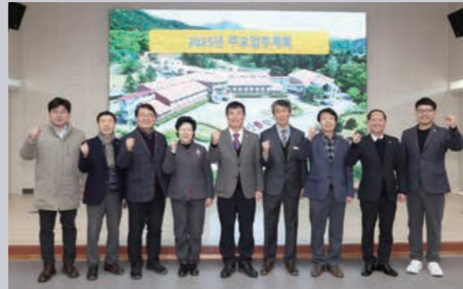
교육위원회 현지시찰 | 2025. 2. 6.(목) 강원특별자치도교육청 학생교육원