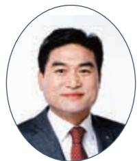
대표발의: 김정수 의원 농림수산위원회·국민의힘·철원1

공동발의 권혁열 의원(농림수산위원회·국민의힘·강릉4), 박길선 의원(농림수산위원회·국민의힘·원주1), 엄윤순 의원(농림수산위원회·국민의힘·인제), 이지영 의원(농림수산위원회·더불어민주당·비례), 진중호 의원(농림수산위원회·국민의힘·양양), 최중수 의원(농림수산위원회·국민의힘·평창2), 한창수 의원(농림수산위원회·국민의힘·횡성1)