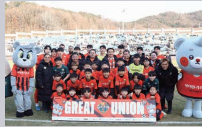
강원FC정규리그 홈경기 개막식 | 2025. 2. 23.(일) 춘천(송암스포츠타운)