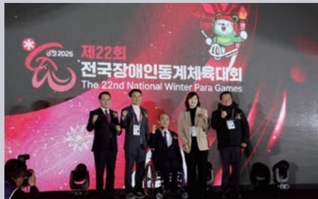
제22회 전국장애인동계체육대회 개막식 | 2025. 2. 11.(화) 강릉(라카이 샌드파인리조트)