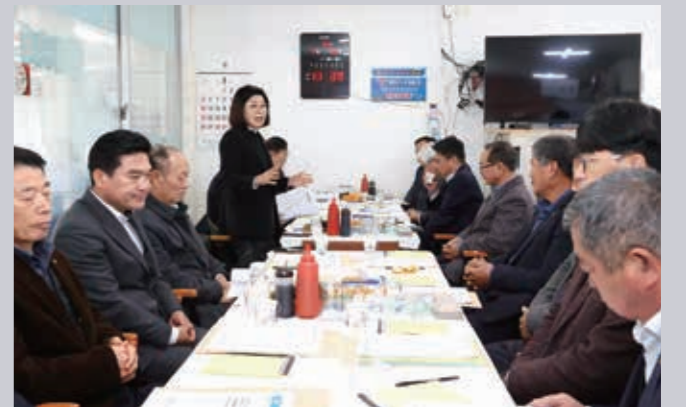
농림수산위원회 민생현장 방문 | 2025. 1. 21.(화) 양양