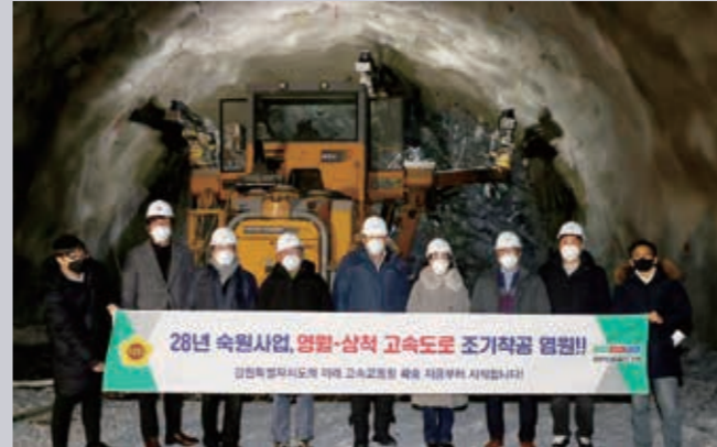
안전건설위원회 민생현장 방문 | 2025. 2. 6.(목) 태백, 정선