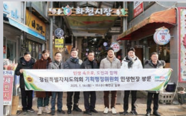
기획행정위원회 민생현장 방문 | 2025. 1. 14.(화) 화천