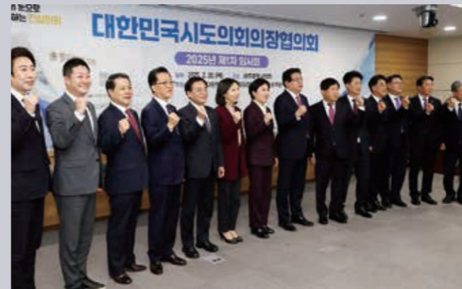
대한민국시도의회협의회 2025년도 제1차 임사회 | 2025. 2. 20.(목) 광주광역시의회