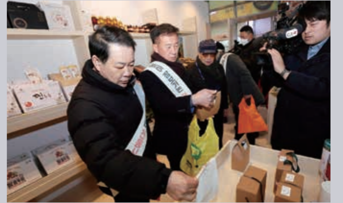
설맞이 전통시장 장보기행사 | 2025. 1. 21.(화) 양구(양구중앙시장)