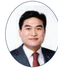
대표발의: 김정수 의원 농림수산위원회·국민의힘·철원1

공동발의 권혁열 의원(농림수산위원회·국민의힘·강릉4), 박길선 의원(농림수산위원회·국민의힘·원주1), 엄윤순 의원(농림수산위원회·국민의힘·인제), 이지영 의원(농림수산위원회·더불어민주당·비례), 진중호 의원(농림수산위원회·국민의힘·양양), 최중수 의원(농림수산위원회·국민의힘·평창2), 한창수 의원(농림수산위원회·국민의힘·횡성1)