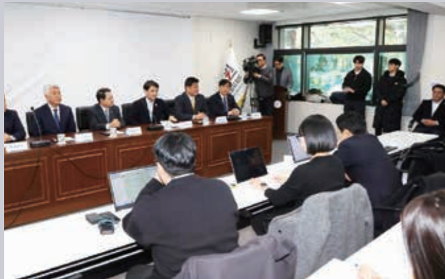
영월-삼척고속도로 건설사업 예타결과조사발표 기지설명회 | 2025. 1. 23.(목) 강릉