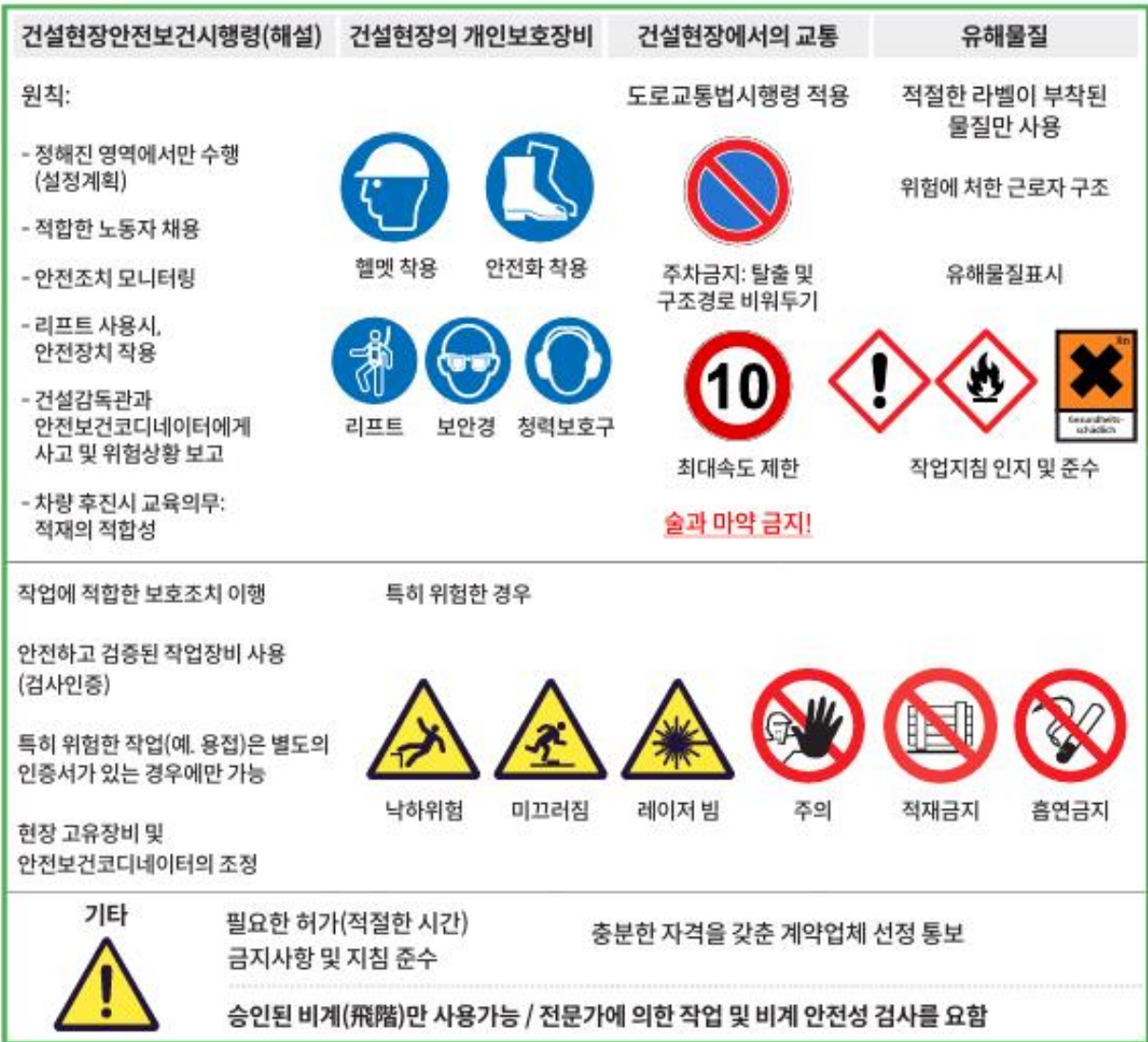
그림 1 「건설현장안전보건시행령」의 주요내용 9)